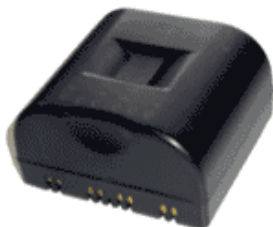
BATLI22 / SP / (Zentr. Sir.) 92,00 €