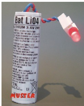
BATLI04 / DP14000 17,50 €