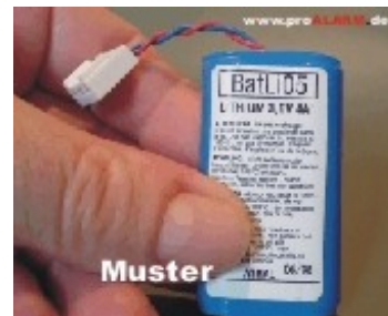
BATLI05 / DP14000 20,00 €