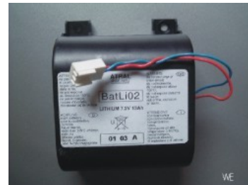
BATLI02 / DP14000 / (Zentrale/AS) 66,50 €