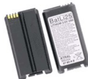
BATLI25 / SP / (KS, IR, Code) 27,00 €