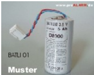
BATLI01 / DP14000 / (Glasbruchm.) 28,50 €