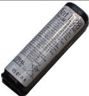
BATLI28/ SP / (KS, IR, Code) 16,50 €